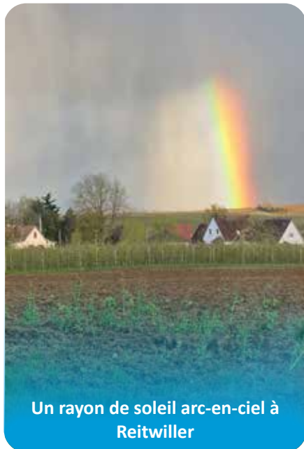
Un rayon de soleil arc-en-ciel à Reitwiller