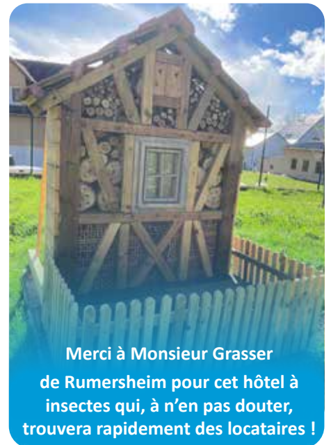
Merci à Monsieur Grasser de Rumersheim pour cet hôtel à insectes qui, à n'en pas douter, trouvera rapidement des locataires !