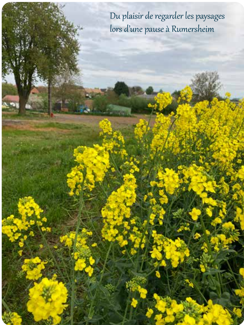
Du plaisir de regarder les paysages lors d'une pause à Rumersheim

Reconnaissez-vous cette petite bouteille ? Les plus âgés se souviendront des mini-briques de lait distribués lors du goûter pris à l'école. Aujourd'hui encore, quotidiennement, cette coopérative collecte à 60 km aux alentours auprès d'agriculteurs proches de chez nous et contribue ainsi à préserver cette activité laitière.