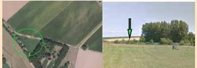
Images Géoportail et Google Street View

Une mare d'environ 100m 2 sera aménagée afin de favoriser la présence et le développement de la faune locale. Des roseaux seront plantés le long des berges.