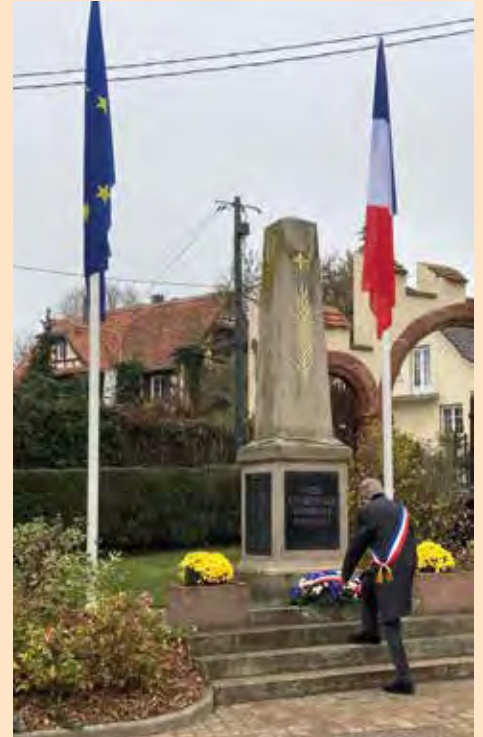
Monsieur le maire devant le monument aux morts de Berstett