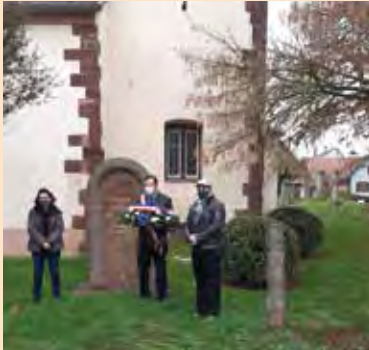
à Gim Brett

Chaque année, nous avons l'habitude de nous souvenir de l'Armistice de 1918. Cet événement qui marque notre histoire de France et encore davantage notre terre alsacienne a fait l'objet d'une cérémonie dans chaque village, plus intime qu'à l'accoutumé en raison de la pandémie.