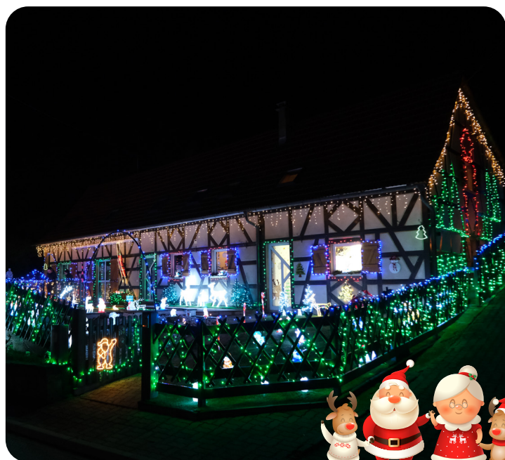
Gimbrett en Lumières