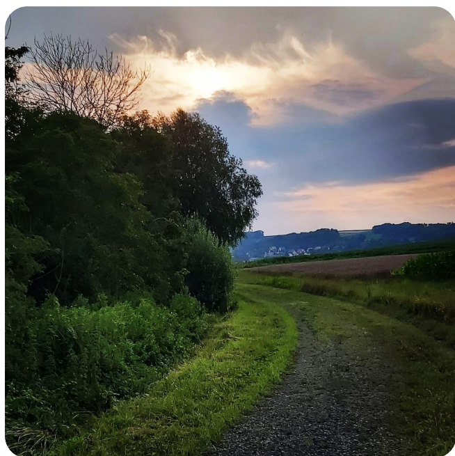
Rumersheim- Reconnaissez-vous l'endroit ?