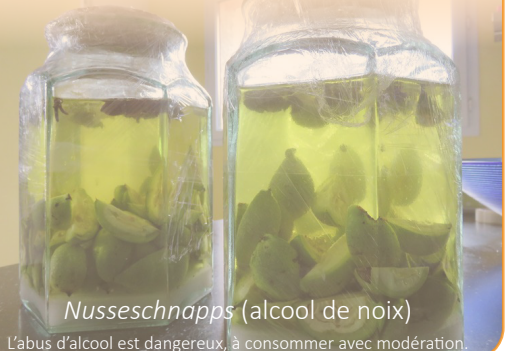
Nusseschnapps (alcool de noix)

Pour plus d'informations, contactez Cécile Freysz Par téléphone/SMS au 06 38 02 77 66 ou par mail à cecile.freysz@gmail.com